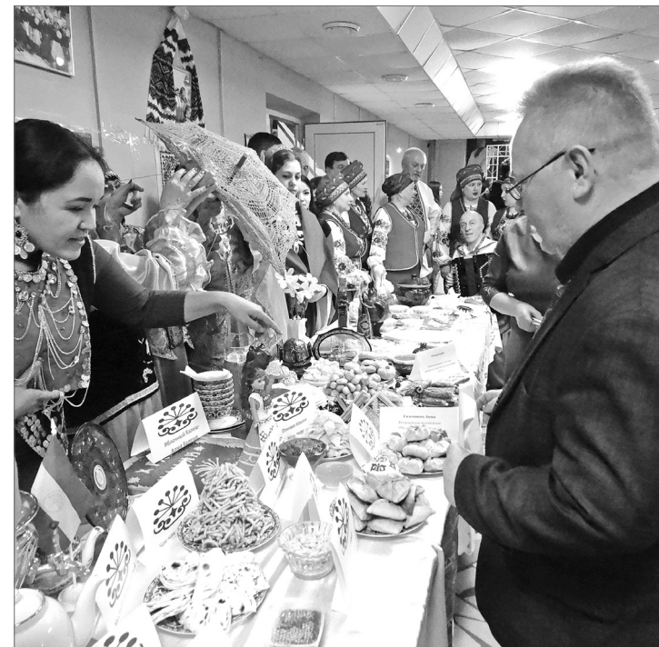
Столы на фестивале ломились от яств.