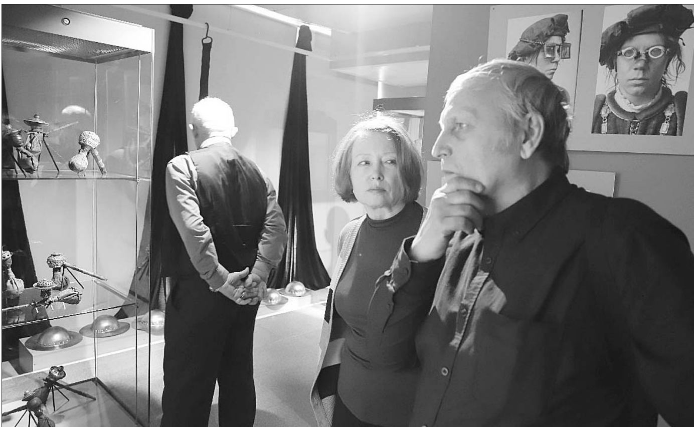
Трудно быть Богом. И человеком – не легче... Выставка не просто фантастична. Она погружает в философские размышления.

Вполне возможно, что именно с этой экспозиции начнётся чьё-то знакомство с творчеством братьев Стругацких. «Средневековый город. Киноверсия» – выставка с таким названием проходит в художественной галерее городского краеведческого музея имени Тимофея Шуваева. В ней отра-