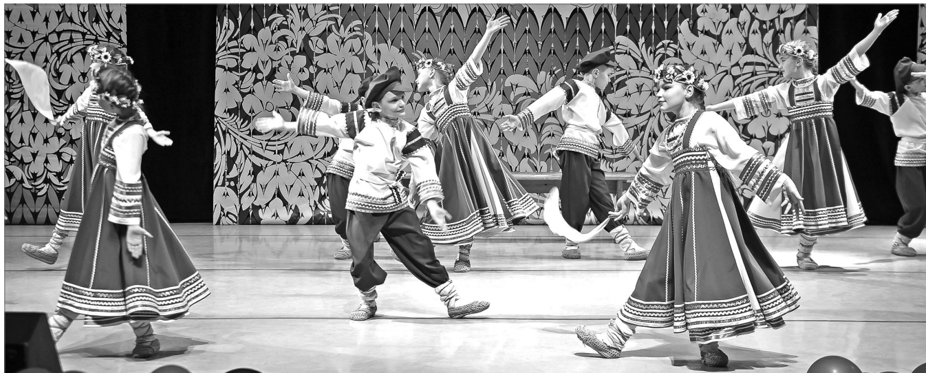
Выступают артисты коллектива «Узоры Самоглора».

Хоровод народных танцев, калейдоскоп ярких костюмов, целый океан чувств и эмоций – всё это ожидало зрителей на юбилейном концерте «Нить наследия» народного самодеятельного коллектива хореографического ансамбля народного танца «Узоры Самоглора». На сцене Дворца культуры «Октябрь» развернулось яркое представление, ставшее результатом плодотворной работы и неустанного творческого поиска руководителя и воспитанников коллектива.