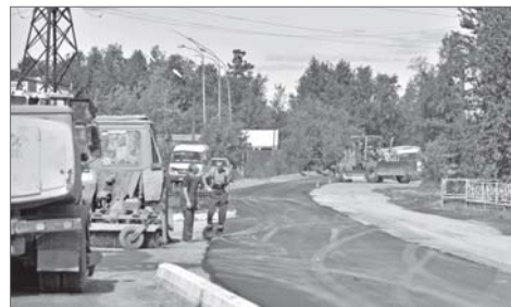
На улице 9П проведено сплошное асфальтирование и обустроены тротуары.

Управление по дорожному хозяйству и благоустройству города в течение лета проводит сезонные работы, которые относят-