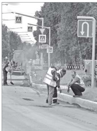
На улице М. Жукова проведены работы по сплошному асфальтированию.

В финансировании дорожного ремонта приняла участие также компания «Роснефть», которая выделила на эти цели в рамках социального партнёрства более 50 млн рублей.