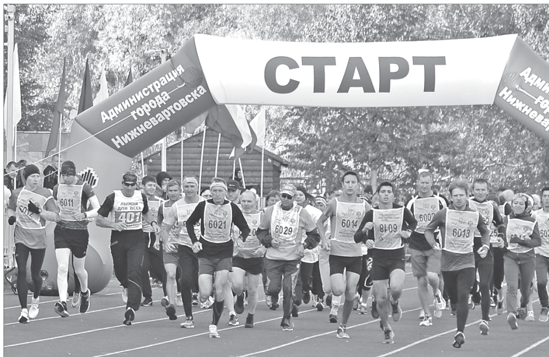
Массовый забег на 2,5 км - традиционная дистанция легкоатлетического кросса.

Выходные в Нижневартовске прошли в беговом ритме. На стадионе имени Алексея Беляева прошёл легкоатлетический кросс «Золотая осень» в рамках городского праздника «Здоровье» и Всероссийского «Кросса нации».