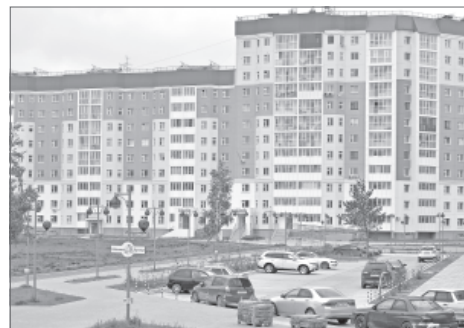
Проект благоустройства Рябинового бульвара был реализован благодаря средствам инвестора - ЗАО «Нижневартовскстройдеталь».

На сегодняшний день за счёт средств инвесторов на территории города реализуется 30 инвестиционных проектов, сообщает управление по взаимодействию со СМИ администрации города. Наиболее крупные из них - строительство котельной в квартале В-5 для теплоснабжения жилой застройки и застройки общественного назначения Восточного планировочного района; многофункциональный комплекс по оказанию услуг населению культурно-досугового, спортивно-оздоровительного направления, детского развлекательного комплекса, общественного питания и другие.