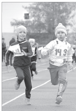
Будущие чемпионы - воспитанники детского сада №14 «Солнышко».

Римма Гайсина. Фото из архива ООО «РН-Снабжение».