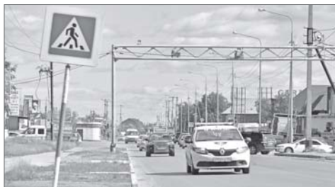
Участок дороги на улице Лопарева тоже обновился.

Дорожники ООО СК «ЮграТрансАвто» в положенный срок завершили асфальтирование участка автомобильной магистрали длиной около 2 тысяч метров, пролегающего по улице Лопарева от улицы 60 лет Октября до переулка Клубного. Здесь обновили бордюры на одной стороне улицы и укрепили обочины на противоположной её части. На ремонт дороги было израсходовано около 50 млн рублей.