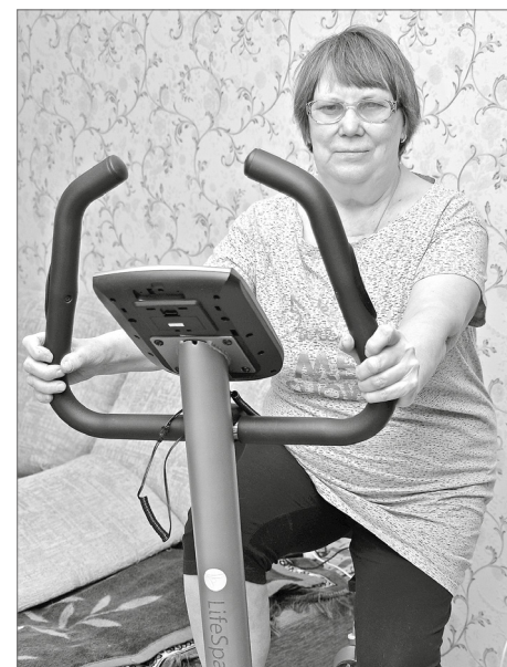
Вперёд по тропе здоровья!

- Партийный проект «Единая страна - доступная среда», реализация которого продлится как минимум до 2022 года, направлен на поддержку и интеграцию в общество людей с ограниченными возможностями и в первую очередь на привлечение внимания к условиям, с которыми сталкиваются маломобильные группы населения при пользовании социальной инфраструктурой города.