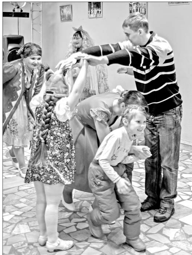
За счастьем и здоровьем - сквозь «Серебряные ворота».

Даже в самые морозные вечера допоздна светятся окна Нижневарттовского центра национальных культур. Здесь в добром соседстве уживаются и поддерживают друг друга представители многих народностей. Все они ходят друг к другу в гости - обмениваться родственной силой.