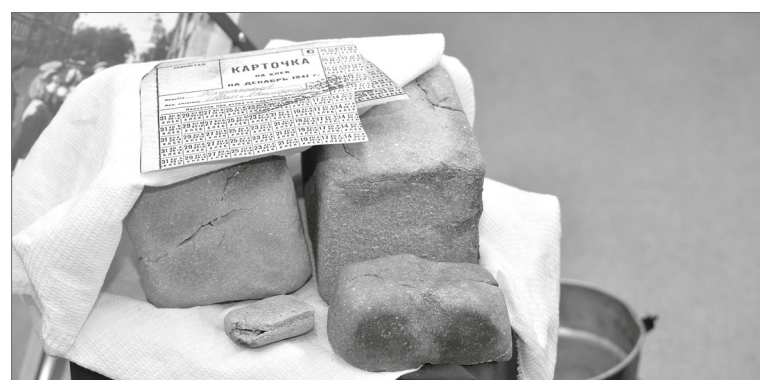
125 граммов хлеба на человека. Сегодня - это крохи. В блокадном Ленинграде они давали людям шанс выжить.

До мелочей воспроизвести в одном из выставочных павильонов обстановку квартиры города, который 872 дня был в осаде, взялись педагоги Центра детского и юношеского технического творчества «Патриот».