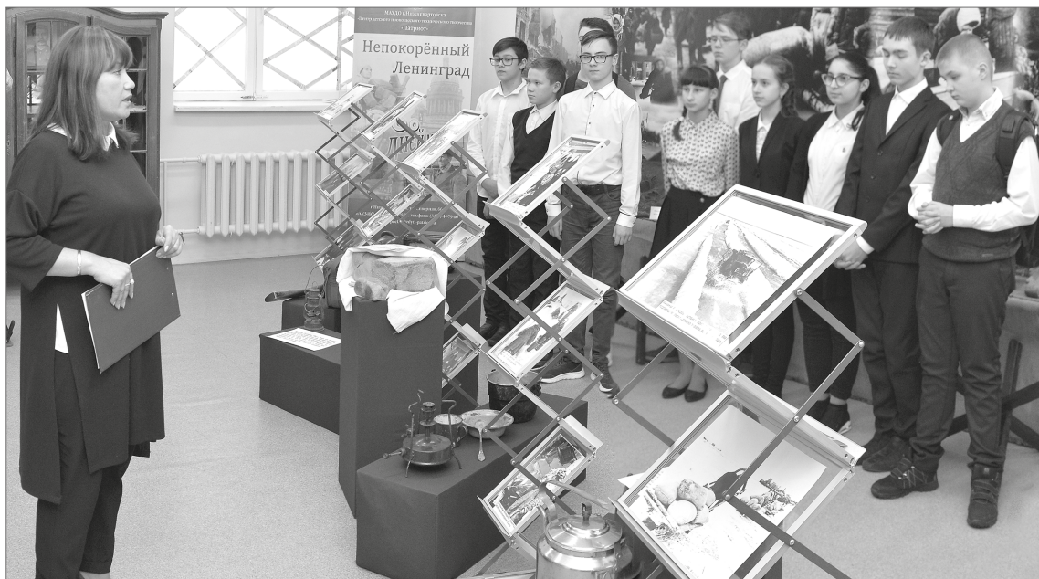
История в оживших декорациях: школьникам Нижневартовска предложили представить себя на месте жителей блокадного Ленинграда.

Еле отапливаемая комната, где на десятке квадратных метров ютятся семья из нескольких человек, осколки снарядов, день за днём терзающие здание дома, железная кровать... Чтобы понять, каково было жителям блокадного Ленинграда, нужно представить себя на их месте. До мелочей воспроизвести в одном из выставочных павильонов обстановку квартиры города, что 872 дня был в осаде, взялись педагоги Центра детского и юношеского технического творчества «Патриот». Организаторы открытого урока «Блокада Ленинграда» дали возможность подросткам XXI века окунуться в историю своей страны, создав эффект присутствия, познакомиться с проживающими в Нижневартовске очевидцами ужасов сороковых.