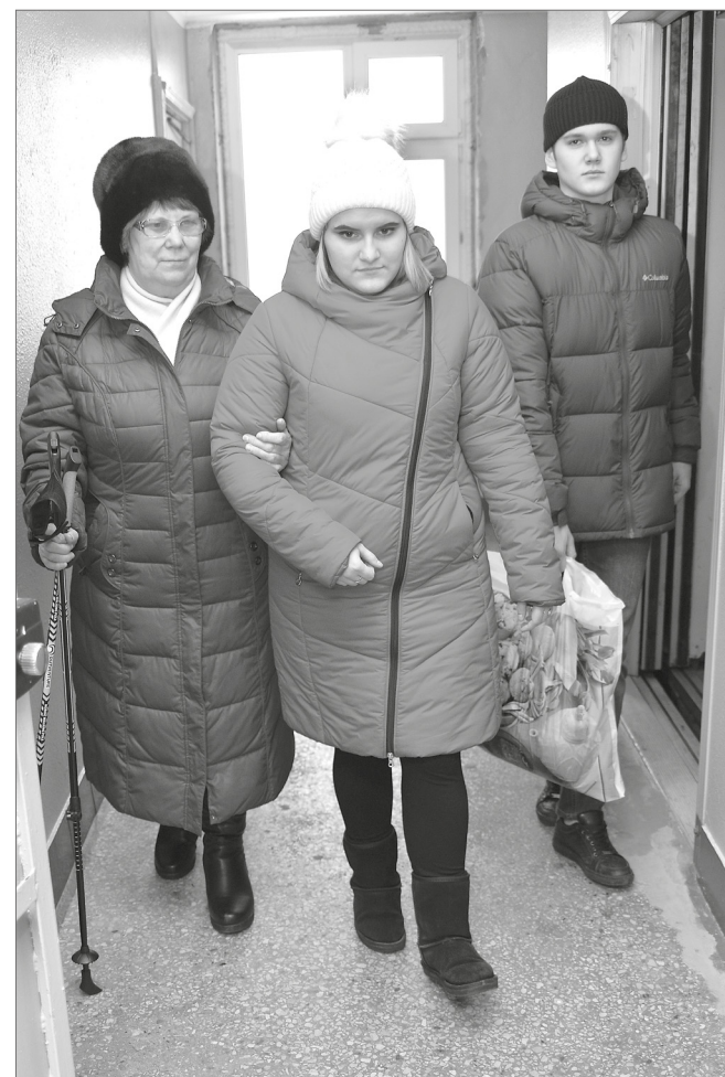
И погуляли, и продуктов набрали.