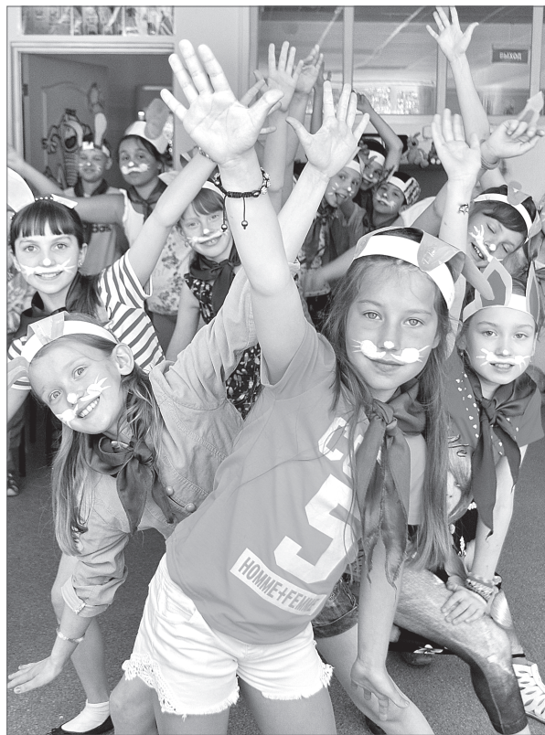
В лагере Центра детского творчества в прошлом году снимали мультфильмы, а в нынешнем готовятся открыть «Студию «Панама».

Управление по информационной политике администрации г. Нижневартовска.