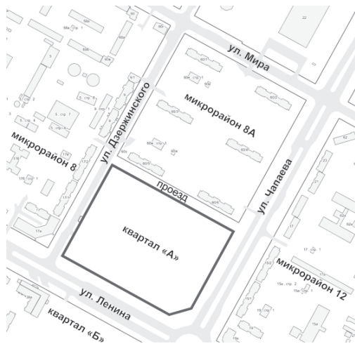
Схема расположения элемента планировочной структуры «Квартал «А»