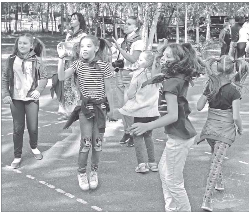
Весело и интересно проводят время дети в лагере «Панама».