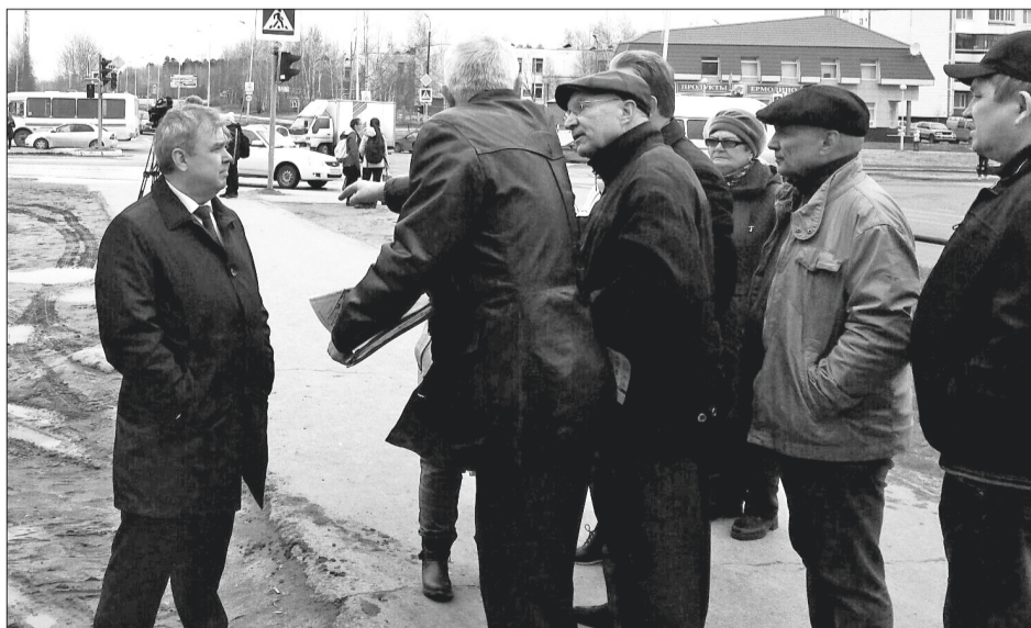
«Живые» вопросы только в кабинете не решаются. Поговорить с избирателями очень важно.

созданы безопасные условия для детей, посещающих лицей, и, конечно, для всех прохожих. Общими усилиями депутатов и специалистов администрации некоторые проблемные вопросы уже удалось решить. Естественно, ещё немало дел, которые требуют разбирательства, выделения дополнительных средств из бюджета, согласований с разными структурами или собственниками жилья. Всё, что в рамках полномочий депутатов на муниципальном уровне, мы решаем собственными силами. Нередко обращения граждан сигнализируют о необходимости вносить изменения в нормативные акты или в законодательство. В таких случаях сначала вопрос обсуждается на заседаниях комитетов в городской Думе. При необходимости готовим обращение и выходим с инициативой в окружной парламент. Напомню, все кандидаты шли на выборы под лозунгом «Мы одна команда – команда Югры». Это, на мой взгляд, правильная тактика, которая даёт положительные результаты. Хочу отметить, что многие предложения нижневартовских депутатов находят поддержку у наших коллег в парламенте Югры. Не зря же говорится, что один в поле не воин. Благодаря совместным действиям депутатов, жителей, администрации города и при поддержке окружной власти мы улучшаем комфортность нашего города.