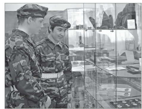
Римма Гайсина.

Раритетные экспонаты и живой интересный рассказ экскурсовода позволяют донести до ребят события прежних лет, воспитывают уважение к героизму, бережное отношение к хлебу, который, как известно, всему голова. Даже в наш сытый век.