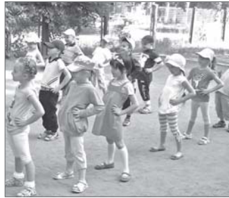
Вот так обычный детский сад благодаря союзу талантливых людей становится местом праздника, радости и творчества.

составлена таким образом, чтобы на сцене детишки и их родители выступали и с сольными номерами, и вместе. Артисты мастерски играли на музыкальных инструментах знаменитые произведения Иоганна Штрауса. Композиции «короля вальса» перенесли всех гостей концерта в таинственный мир XIX века. Волшебная атмосфера «Сказок Венского леса», грациозность «Летучей мыши», ликующий «На прекрасном голубом Дунае» - это ли не может привести в восторг? Тем более, если за инструментом - твои родители! Ещё один повод гордиться ими.