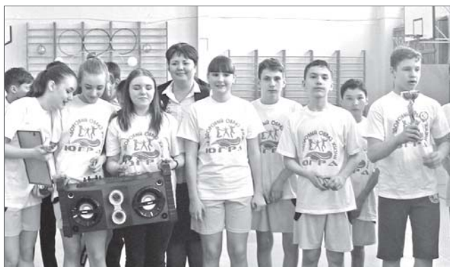
Вот они - самые спортивные и дружные.

Летние каникулы в разгаре, и школьники стараются получить от этой прекрасной поры максимум. Самое главное, конечно же, набраться сил для продолжения учёбы. Мальчишки и девчонки 7-в класса средней школы №43 на летний отдых отправились в статусе «Здоровый класс». Именно они стали победителями одноимённого городского конкурса.