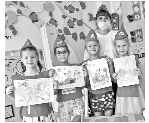
Всё то, что создавала природа веками, может погибнуть в огне за несколько часов. Берегите лес от пожаров!

Лес – это зелёная одежда земли и наше самое большое богатство. В настоящее время в большинстве случаев его возгорания виноват сам человек. Поэтому с целью закрепления правил пожарной безопасности в лесу в МБДОУ ДС №54 «Катюша» с участием воспитанников старшего дошкольного возраста была проведена акция «Безопасный отдых в лесу». Ребята подготовили рисунки и рассказали стихи о правилах пожарной безопасности в лесу. Любая неосторожность в обращении с огнём может обернуться бедой для вас, для других людей, для леса и его обитателей.