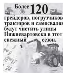
Инфографика Дениса Пашкова.