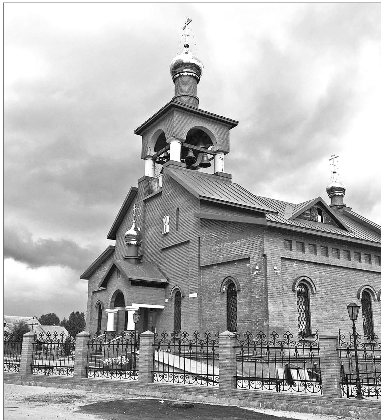
Храм в честь Рождества Иоанна Предтечи (ул. Октябрьская, 44) находится на месте исторически намоленном.