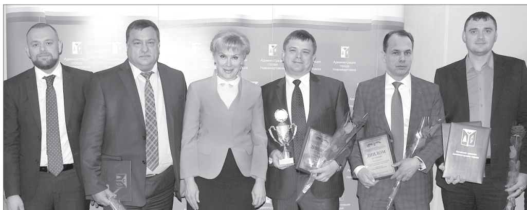
Подведены итоги городского конкурса «Залог успеха - безопасный труд».

В Нижневартовске в преддверии Всемирного дня охраны труда подвели итоги муниципального конкурса «Залог успеха - безопасный труд». Участие в нём приняли 36 предприятий и организаций города.