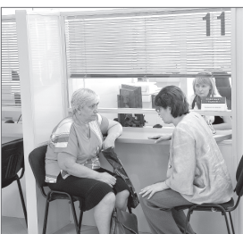
Департамент экономики администрации г. Нижневартовска.

С 10 мая МФЦ будет работать в обычном режиме.