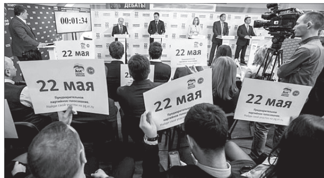
Нина Левченко.

Адреса счётных участков, на которых пройдёт предварительное народное голосование, мы сообщим нашим читателям в одном из следующих номеров «Варты».