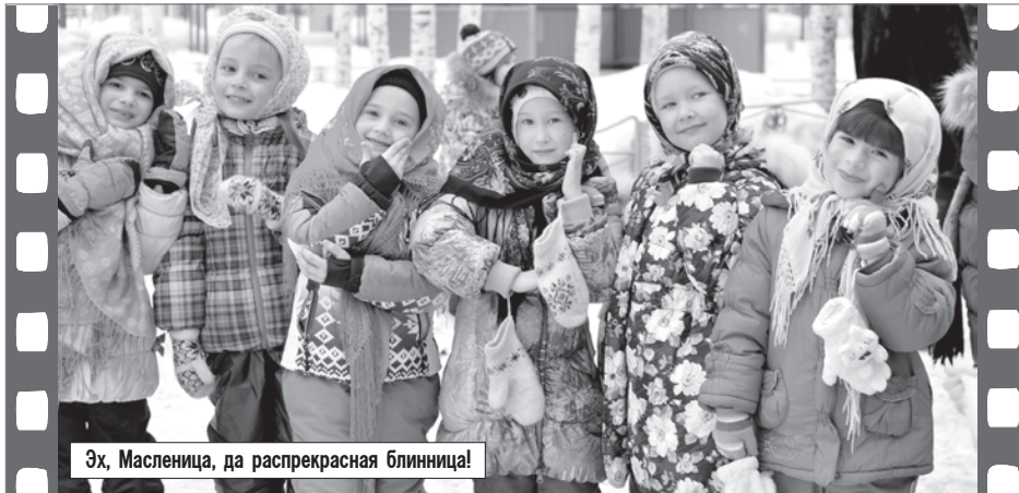
Эх, Масленица, да распрекрасная блинница!