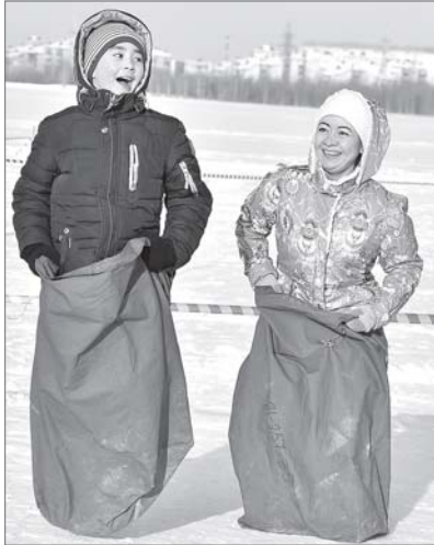
Когда ребенок убегает от родителей - веселого мало, но когда это бег в мешках, ситуация в корне меняется.

Секрет успеха армейской каши для 300 вартовчан: 30 кг гречки; 80 банок тушёнки.