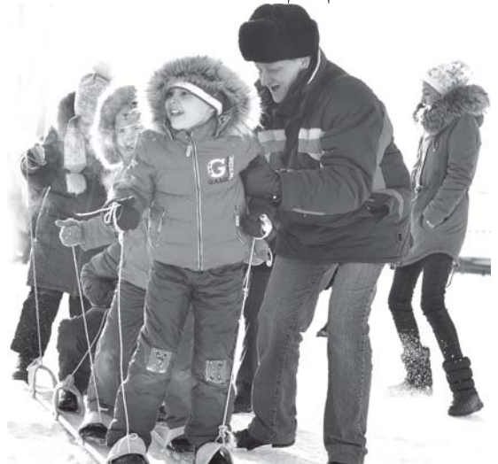
То чувство, когда у тебя не две ноги, а все сорок. И каждой приходится кричать: «Левой! Правой! Левой! Правой!».

Спортивные и шуточные испытания на ловкость, координацию, меткость, сообразительность, чувство плеча и стратегическое мышление принимаются на «ура» как детьми, так и взрослыми.