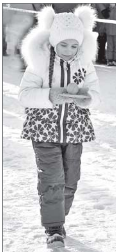
Чтобы донести «снежок» до цели, нужны ловкость и терпение.