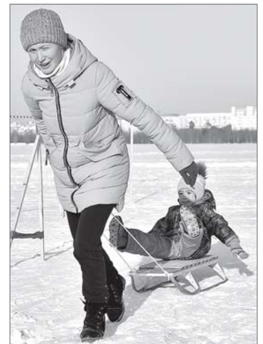
С ветерком да на саночках. Мамы - везут, дети - наслаждаются.