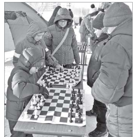
Интеллектуальные баталии - соревнования для ума.