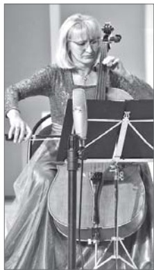
За четыре года в нашем городе состоялось шесть концертов, посвященных великим русским композиторам.

Департамент по социальной политике администрации города.