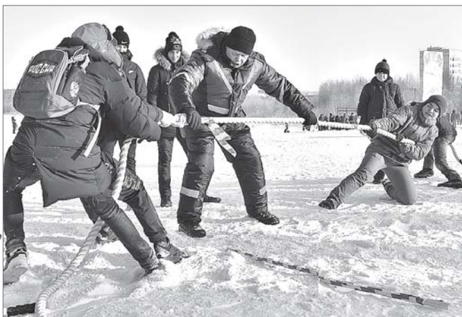
В чем сила, брат? А сила - в единстве.