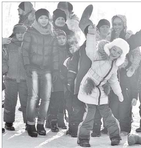
Меткость и сила - превыше всего. И ничего, что бросаешь валенок, главное - дальше других.