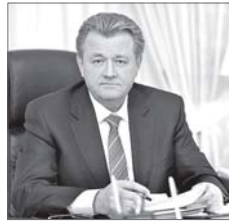
Василий Тихонов, глава города:

- Конечная цель любой нашей деятельности - эффективность и комфорт жителей Нижневартовска как во всём городе, так и в отдельно взятом дворе.