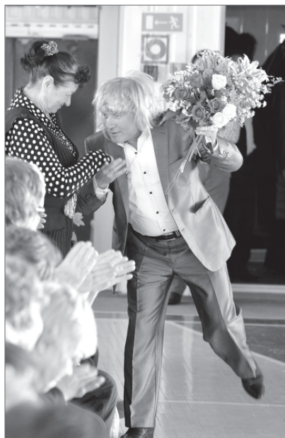
Ну чем ни Николай Басков? «Звездное» поздравление от мужчин.

Чуть заиграет музыка - ноги сразу в пляс. Женщинам - бывшим работницам АО «Самотлорнефтегаз» - сложно усидеть на месте. Для них, активных, бойких, юморных, в честь 8 Марта администрация, первичная профсоюзная организация и Совет ветеранов предприятия организовали особенный праздник.