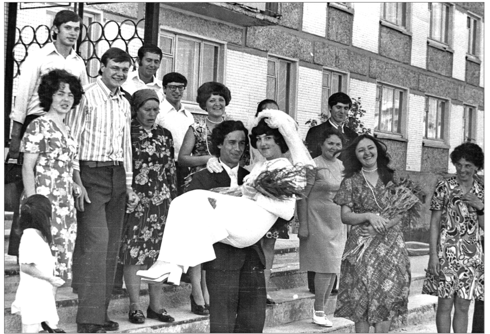
Уникальные самотлорские свадьбы.