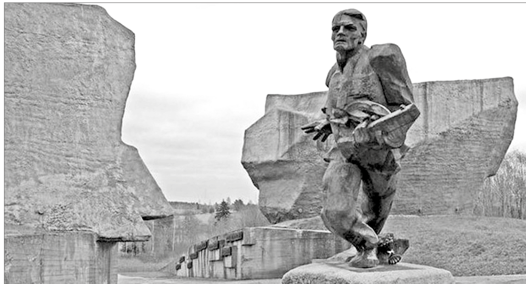
Мемориальный комплекс «Прорыв» в городе Ушачи, Витебская область.