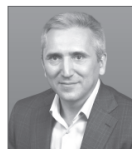
Александр Моор, врио губернатора Тюменской области.

Так, в Нижневартовском государственном университете иногородние живут в семиэтажном современном общежитии на 262 места, построенном в рамках программы.