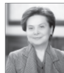
Наталья Комарова, губернатор ХМАО - Югры.

- Тюмень, Ямал и Югра крепко связаны между собой историей, экономикой и человеческими судьбами. Сотрудничество - это образ нашей жизни и взаимоотношений.