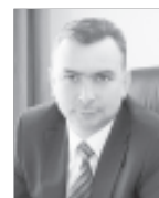
Максим Клец, глава города.

«Я надеюсь, что таких площадок будет всё больше. В городе их планируется ещё двенадцать, но, полагаю, и двенадцати будет мало».