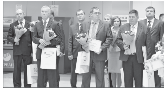
Почётные работники коллектива АО «Самотлорнефтегаз».