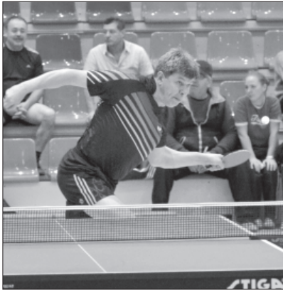
Виртуозный удар - соперник в проигрыше.