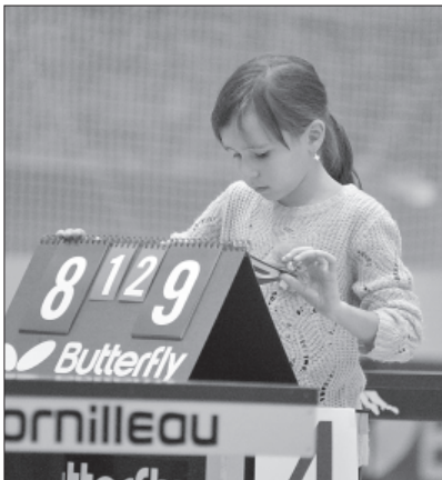
Пока еще не в турнире, но уже судья.

Соревнования по настольному теннису среди ветеранов спорта в рамках празднования Международного дня пожилых людей проходили в спорт-комплексе «Триумф». В спортивном зале собралось около полусотни участников, среди которых 10 представительниц прекрасного пола. Спортсмены были не только из Нижневартовска, но и из Мегиона, Покачей, Стрежевого, Радужного. Соревнования проводились по круговой системе в нескольких возрастных категориях.