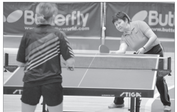
Женский стиль игры - кто хитрее, тот и выиграл.