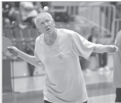
Сила притяжения взглядом - отвлекающий маневр.