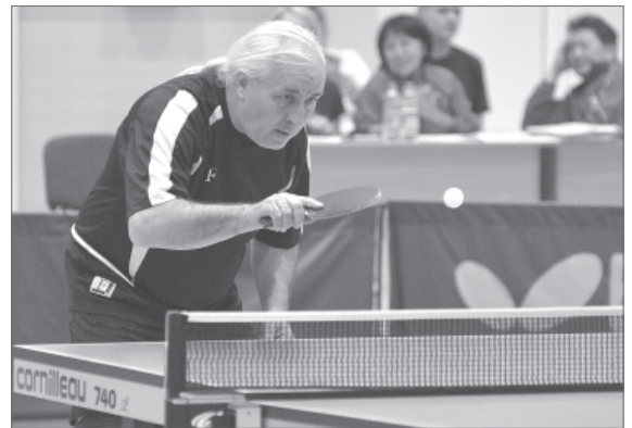
Восточная хитрость, тонкий расчет...