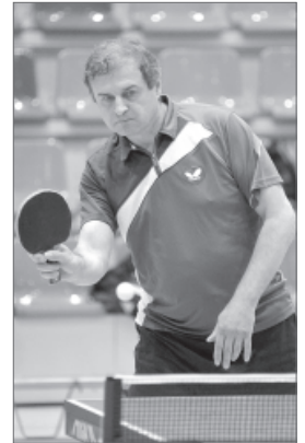
Концентрация профессионала - залог победы.