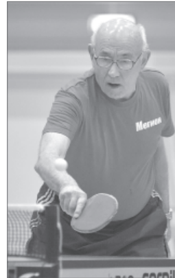
Уверенный удар и в 75 лет.