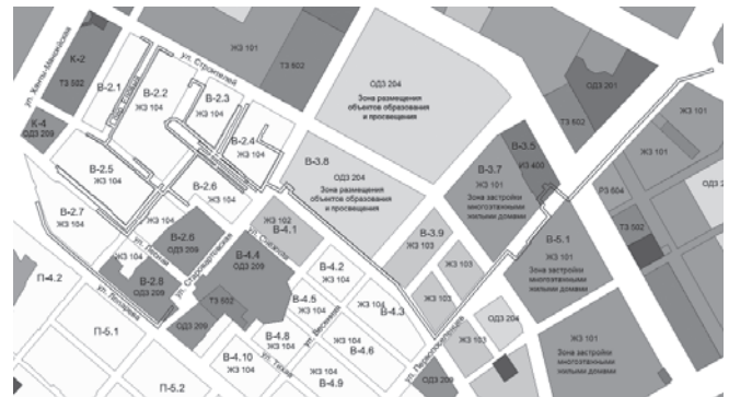
Схема границ проектируемой территории для размещения линейного объекта «Инженерное обеспечение жилых кварталов В-2.1, В-2.2, В-2.3, В-2.5, В-2.6»