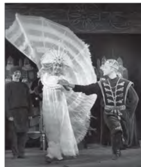
Подготовила Юлия Насонова.

19 часов - мистический триллер по произведению А. Толстого (12+) «Семья вурдалака» (постановка П. Акинина).