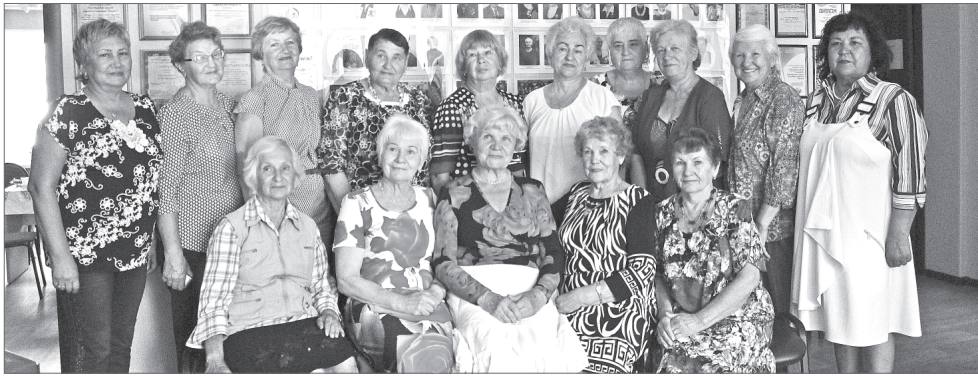
«Серебряные» волонтеры Нижневартовской городской общественной организации «Ветеран».