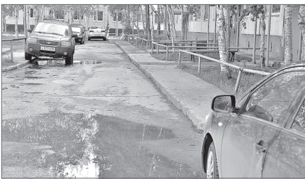
Собравшись вместе, жильцы дома на Комсомольском бульваре, 16-а могут облагородить свой двор.