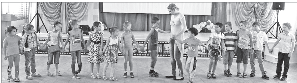
Мальчишки и девочки с азартом повторяли за ведущей различные «кричалки».

Первая смена в лагерях дневного пребывания детей закончилась. Стартвала вторая, и у многих ребят сейчас проходит период адаптации.