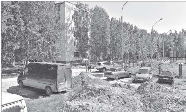
Пока жители 1 микрорайона вынуждены обходить эти кучи песка. Но никто не сетует - на месте пустыря уже благоустраивается аллея.

Добавим, по условиям контракта на все работы действуют гарантийные обязательства. В случае некачественно выполненных работ или обнаруженных дефектов подрядчик должен будет устранить недочёты за собственный счёт.