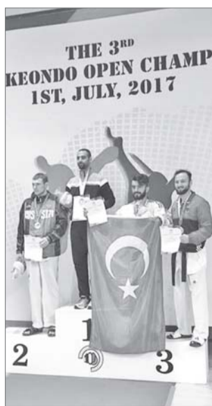
Управление по физической культуре и спорту администрации Нижневартовска.

Спортсмены Югры стали обладателями серебряных медалей на международных соревнованиях по тхэквондо среди лиц с поражением опорно-двигательного аппарата. Турнир проходил с 29 июня по 4 июля в г. Чхунхон (Южная Корея).