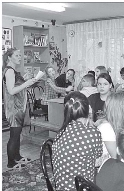
Дети в подростковом клубе «Факел» на викторине по экологии.