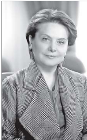
Наталья Комарова, губернатор Югры:

Вартовчане внесут свои предложения в окружной план мероприятий, посвящённых Десятилетию детства в России. По словам губернатора Югры Натальи Комаровой, план должен стать «народным».