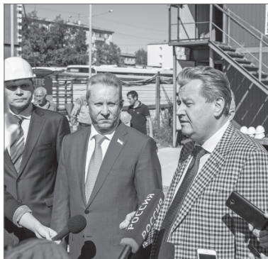
Возведение объекта регионального значения находится под пристальным вниманием окружающих и городских властей, народных избранников и общественности.