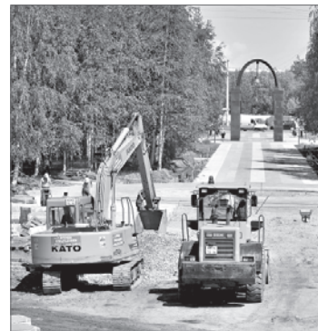
Работы по обустройству Комсомольского бульвара идут полным ходом. Оценить полностью обновленный бульвар горожане смогут этой осенью.

На сегодняшний день выполнено 80% запланированного объёма работ. После установки бордюрного камня строители уже приступили к укладке плитки. За ходом работ пристально следят не только в администрации города, капитальный ремонт монумента стоит на особом контроле у губернатора Югры Натальи Комаровой. Посещение строительной площадки в обязательном порядке значится в каждой рабочей поездке главы города Василия Тихонова. Поставить жирную точку в истории затянувшегося ремонта символа Нижневартовска строители обязуются не позднее 16 августа.