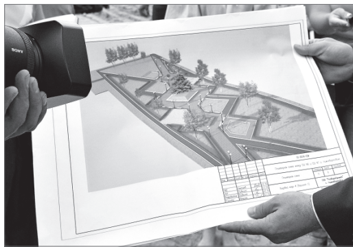
План-проект пешеходной аллеи между школами №6 и №7. Новое место отдыха понравится как детям, так и взрослым.