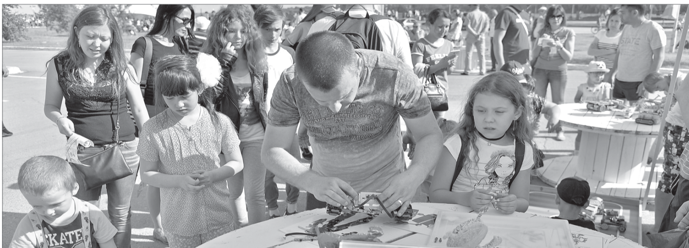
У нижевартовских общественников есть идеи для реализации Десятилетия детства в России.