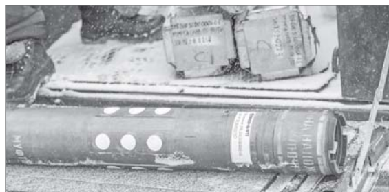
Многоразовые разрывные муфты - новый метод борьбы с обводнённостью.