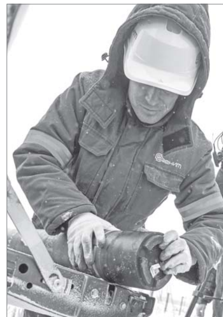
Технологию управляемых муфт внедряют на всех участках «Самотлорнефтегаза».