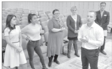
Учились и педагоги. На одном из семинаров они узнали о формах и методах добровольческой деятельности, а также получили несколько практических заданий, призванных обучить социальному взаимодействию.