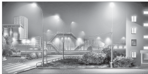
Проект улично-городской сети в рамках энергосбережения сферы ЖКХ.

Добавим, молодёжный энергетический форум поддержали Федеральное агентство по делам молодёжи РФ (Росмолодёжь), администрация города Нижневартовска, местная общественная организация «Работающая молодёжь города Нижневартовска» и Фонд содействия реформированию жилищно-коммунального хозяйства.