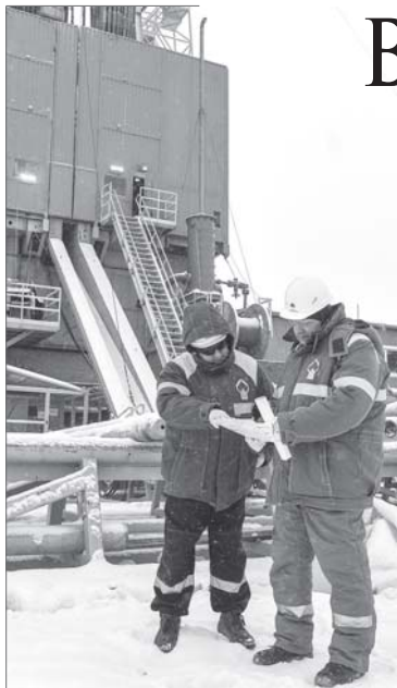
Первые пять скважин с проектным смещением пробурили летом 2017 года.

На Самотлорском месторождении активно реализуется проект, аналогов которому в Югре ещё не было. В работе с труднодоступными краевыми районами нефтяникам АО «Самотлорнефтегаз» помогает инновационная технология. Речь идёт о бурении скважин с большим проектным смещением.