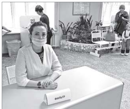
В поликлиниках действует «пропускной фильтр».

Накануне в одной из частных аптек города не было медицинских масок и оксолиновой мази. Фармацевт вежливо объяснила, что раскупили их в течение дня. Однако уже наутро здесь всё появилось на прилавках. Обзвонив ряд других аптек, мы выяснили, что дефицита нет вовсе - всё необходимое для предупреждения и лечения сезонных заболеваний есть.