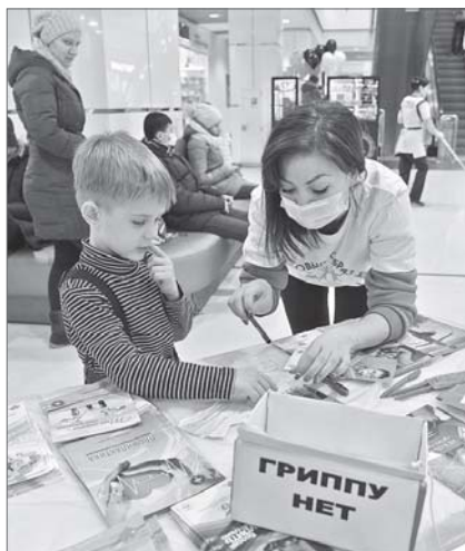
Дети тоже должны знать правила защиты от гриппа.

В сообщении подчёркивается, что в Нижневартовские медицинские учреждения заблаговременно предприняли меры, которые исключают прямой контакт простуженного с пациентами, у которых иной диагноз. В поликлиниках действует «пропускной фильтр», который позволяет разделить потоки больных и здоровых пациентов. Обязательным условием защиты от гриппа и ОРВИ является ношение защитных масок как для населения, так и для каждого работника взрослых и детских поликлиник. В больницах города ограничен приём посетителей.