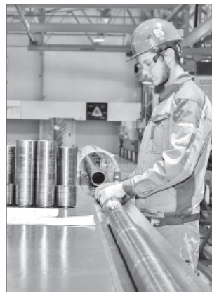
Открытие завода - это создание рабочих мест для вартовчан и жителей соседних городов.

Глава города и директора компании запустили производство насосов, переместив символический рычаг. Для гостей мероприятий устроили экскурсию по производственным цехам. Общая площадь завода - более 7,5 тыс. кв. м - на данной территории могут поместиться 139 стандартных двухкомнатных квартир. Предприятие, на котором всё блещет от чистоты, переворачивает привычные представления о заводе. Вся выпускаемая продукция имеет не только знак качества, но и собственный цвет - синий.