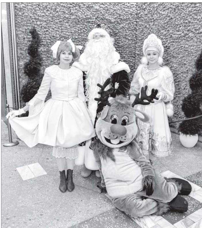
Нижневартовцы приглашены на празднование дня рождения Деда Мороза во Дворец искусств. Завтра, в зале «Под стеклом» в 13 часов ждут горожан и гостей Нижневартовска. Вход свободный.

Все привыкли к тому, что Дед Мороз дарит всем хорошее настроение и подарки. Но у волшебников тоже есть личные праздники и, в частности, у Деда Мороза завтра день рождения. Такая дата появилась в календаре неслучайно.