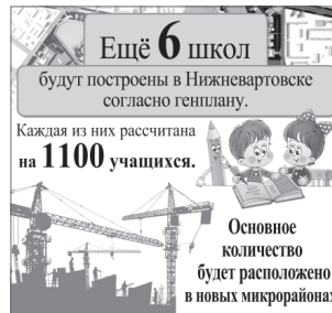
Инфографика Фарилы Чешковой.

Департамент ЖКХ Нижневартовска.