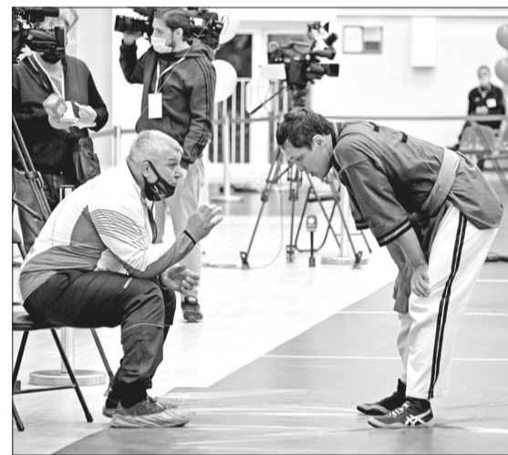
Последние наставления перед схваткой.