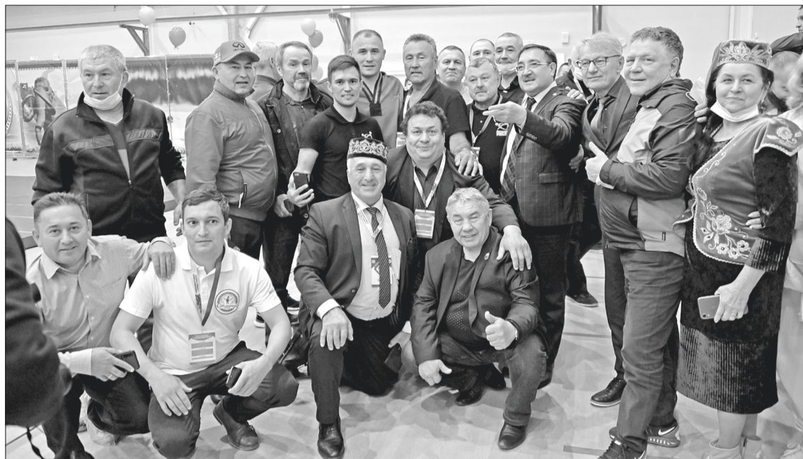
Участники и болельщики Всероссийских соревнований по национальной борьбе корэш.