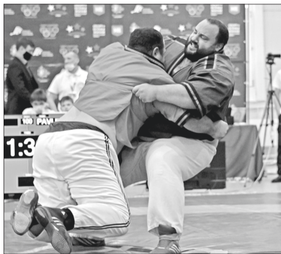
Борьба была нешуточной.