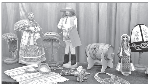
Выставка «Югра многонациональная» в релепитионном зале НВГУ.

Все эти люди собрались вместе, чтобы обсудить одну из актуальных тем современности - межнациональные отношения. И за два дня весьма в этом преуспели. В первый день прошёл информативный «круглый стол», на котором специалисты самых разных областей высказали свои точки зрения. Выступали депутаты Думы города, представители администрации Нижневартовска, Центра национальных культур, центра «Патриот»... Вопрос осветили со всех сторон.