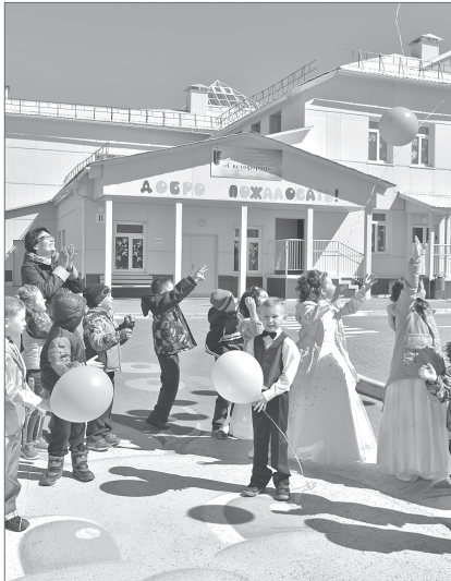
Детский сад №69 «Светофорчик».

На последнем перед летними каникулами заседании Думы города депутаты утвердили изменения в муниципальный бюджет. Администрация города предложила увеличить доходы муниципальной казны на 14 млн рублей и расходы на 114 млн рублей, с увеличением дефицита на 100 млн рублей.