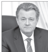
Василий Тихонов, глава города Нижневартовска

Нижневартовск присоединился к окружному проекту по выявлению перспективных инициатив, которые станут импульсом для развития не только города, но и региона в целом. В рамках стратегической недели «Югра - 2024» представители общественности, бизнеса, органов власти обсудили возможности повышения показателей и варианты решения задач, поставленных в мае этого года Президентом России Владимиром Путиным.