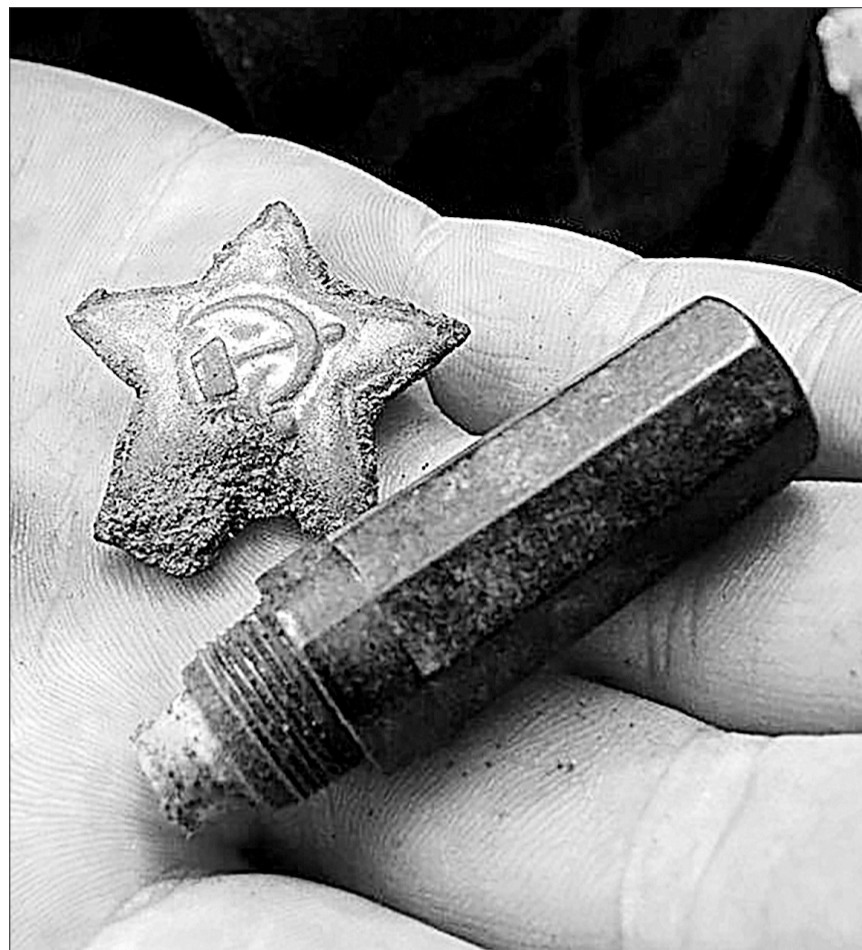
Поисковые отряды школьников каждый год привозят из своих экспедиций такие артефакты – страшные свидетельства войны.