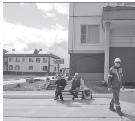
Сегодня условия быта на промысле не сравнить с тем, что было 50 лет назад: на смену вагончикам пришли здания в капитальном исполнении.

Полвека назад никому до того неизвестное озеро Самотлор, затерявшееся в глухой сибирской тайге, возвестило миру о своих несметных богатствах. Когда 29 мая 1965 года первая разведочная скважина выплеснула целый фонтан чёрной маслянистой жидкости, Самотлор стал знаменит. Таких открытий в отечественной практике ещё не бывало. Нефтяное озеро, не скупясь, отдавало свои сокровища, и уже в 1981 году легендарное месторождение поразило мир очередной сенсацией, выдав миллиардную тонну нефти. Знаменитый Самотлор по настоящее время одно из самых перспективных месторождений Западной Сибири.