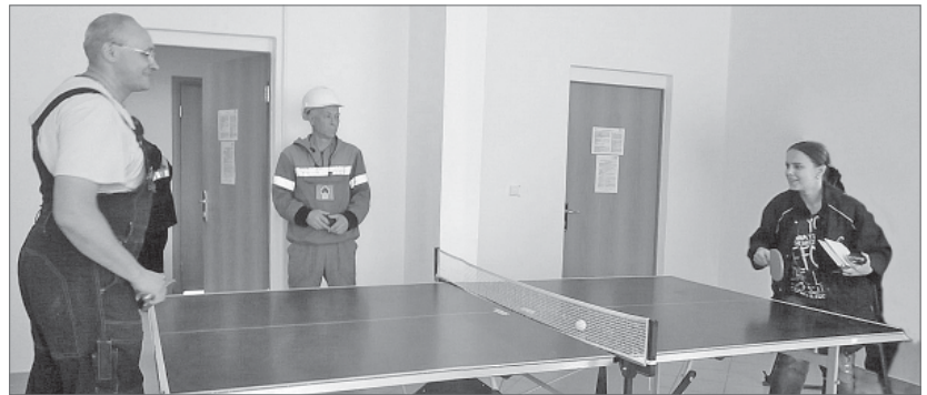
В перерыве между сменами дежурная бригада имеет возможность заниматься активным отдыхом.