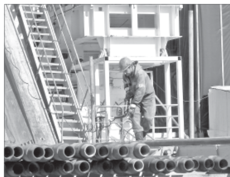
За смену колонну наращивают 12-метровыми трубами 8-10 раз.