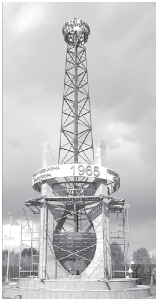
Заканчивается строительство нового мемориального комплекса на первой скважине Самотлора Р-1.