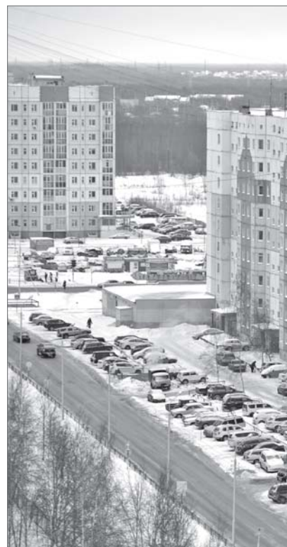
Лидия Уфимцева.