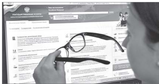
Новое в МФЦ

Департамент экономики администрации города Нижневартовска.