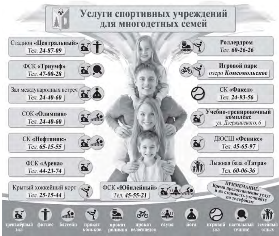
Инфографика Дениса Пашкова.