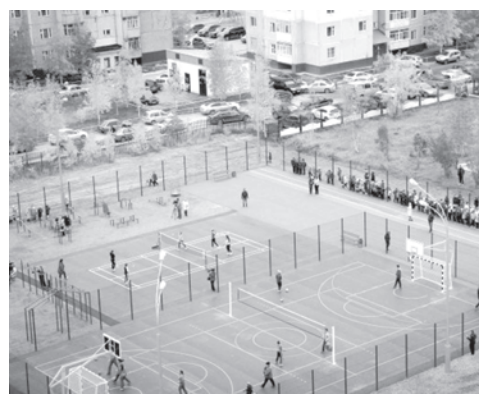
Новый стадион у школы №40 - всем на зависть!

Одной из наиболее актуальных тем, которая всегда звучит в наказах избирателей, депутат Думы города Павел Лариков назвал отведение земельных участков под гостевые автостоянки. Он представил на заседании политсовета обширный отчёт о том, с какими просьбами к нему обращались нижевартовцы, и что удалось сделать. В частности, он отметил, что дополнительные места для парковок выделяются по мере возможности, и в администрации города действует специальная комиссия, которая рассматривает обращения горожан.