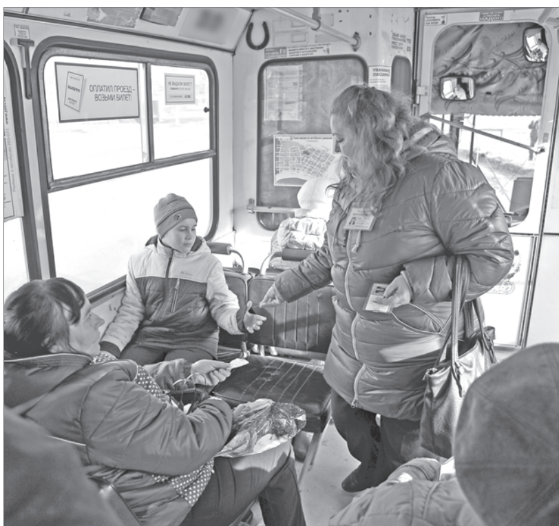
Пассажиров автобуса, выехавших из дома ранним утром, из полусонного состояния вывело вежливое, но настойчивое: «Здравствуйте, приготовьте ваши билеты! На линии работает контроль». Все послушно полезли в карманы и показали талончики об оплате. На этот раз в традиционном рейде по выявлению «безбилетников», который проводит отдел транспорта и связи администрации города, пригласили поучаствовать журналистов. Прошедшая проверка показала очень приятный результат. Около полутора часов работы в автобусах - и ни одного «зайца!»

К слову, о детях. Ребята школьного возраста тоже довольно часто попадают проверяющим. «Часть едет с проездным, но без справки с места учёбы, - отмечает Татьяна Бурухина. - Другие вовсе без денег, проездного и транспортной карты. Хочется напомнить родителям: не забывайте следить, чтобы у ваших сыновей и дочерей была мелочь на проезд или деньги в «электронном кошельке». Это задача взрослых».