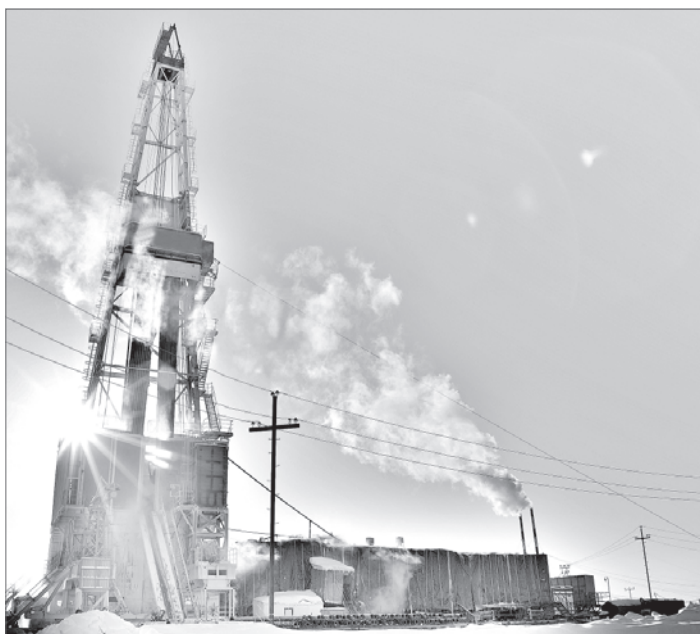
Стационарная буровая установка российского производства.

Солидный возраст месторождения, сложные условия добычи и трудноизвлекаемые запасы нефти - такие препятствия ставит перед нынешними добытчиками «чёрного золота» Самотлор. На это нефтяники АО «Самотлорнефтегаз», дочернего общества НК «Роснефть», отвечают масштабным инвестиционным проектом по бурению и применению инновационных технологий.