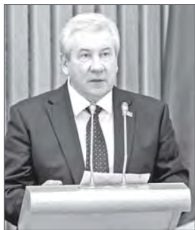
Председатель Думы Югры Борис Хохряков провёл аппаратное совещание.