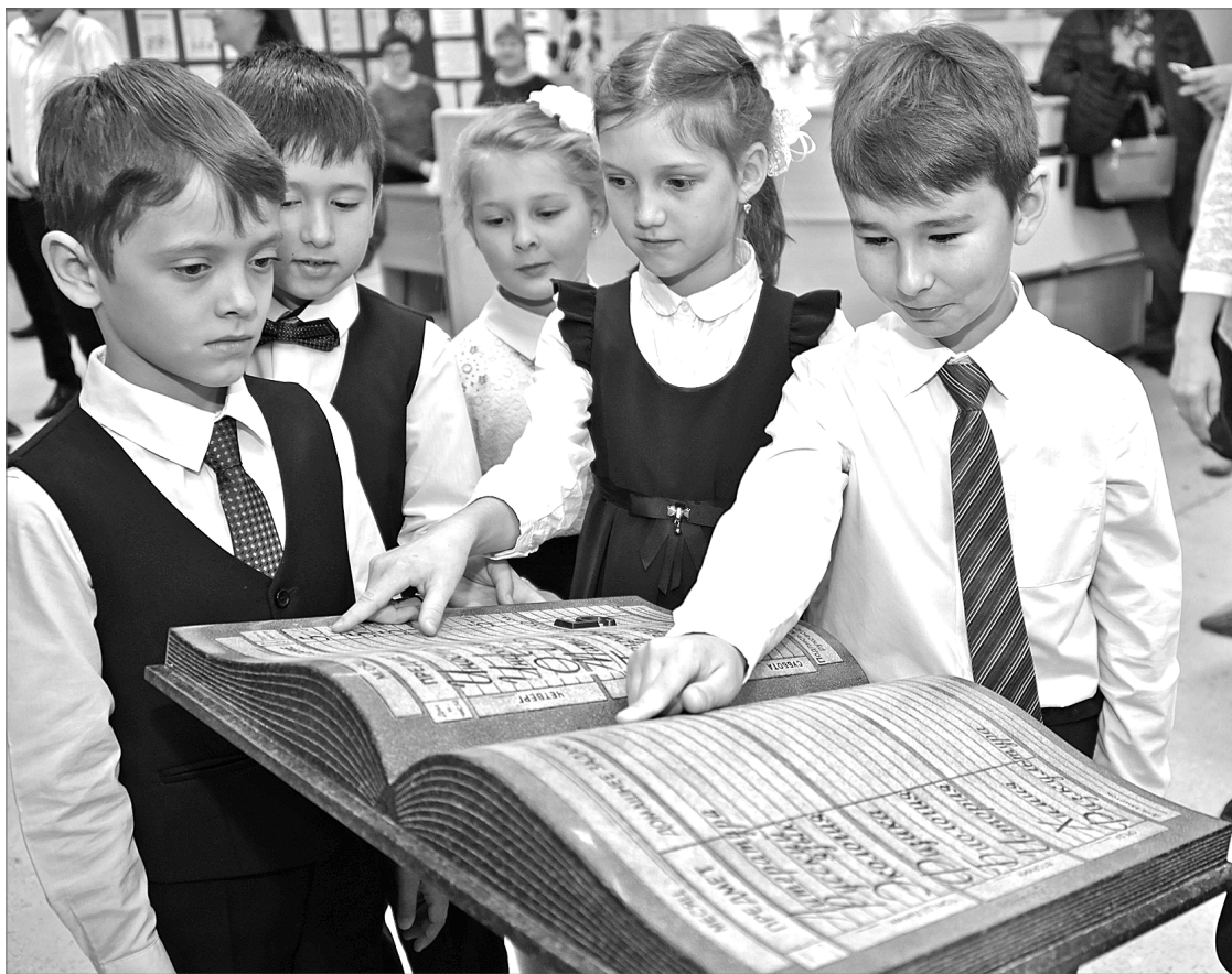
Мы тоже будем учиться на пятёрки!