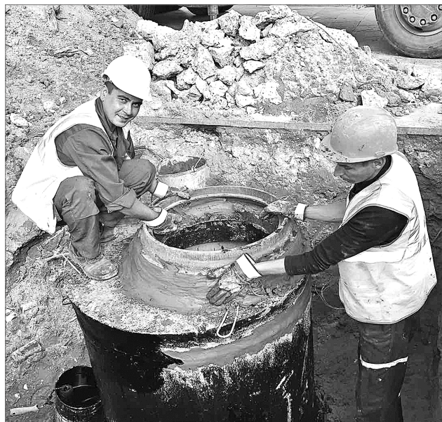
Гидроизоляция колодцев идёт полным ходом.