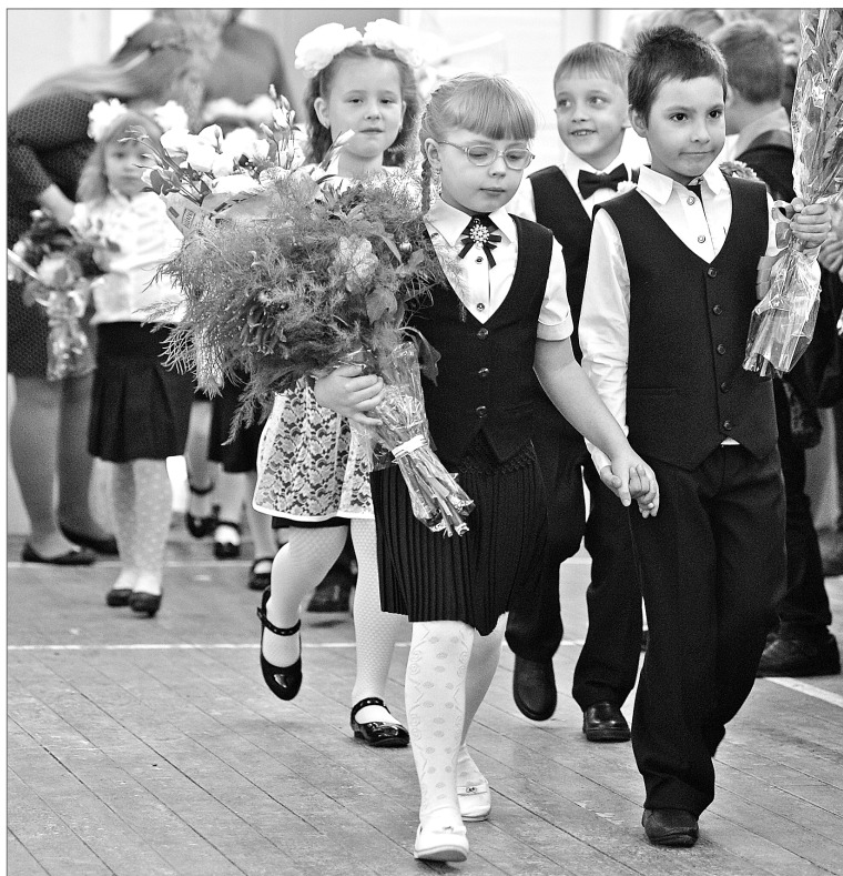
День знаний – праздник для первоклассников.