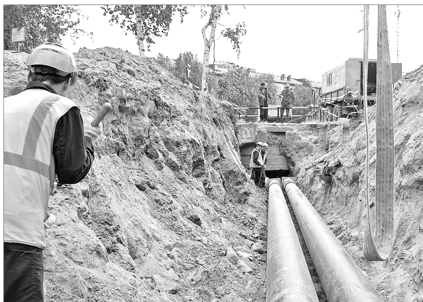
Новые трубы более крепкие и надёжные.