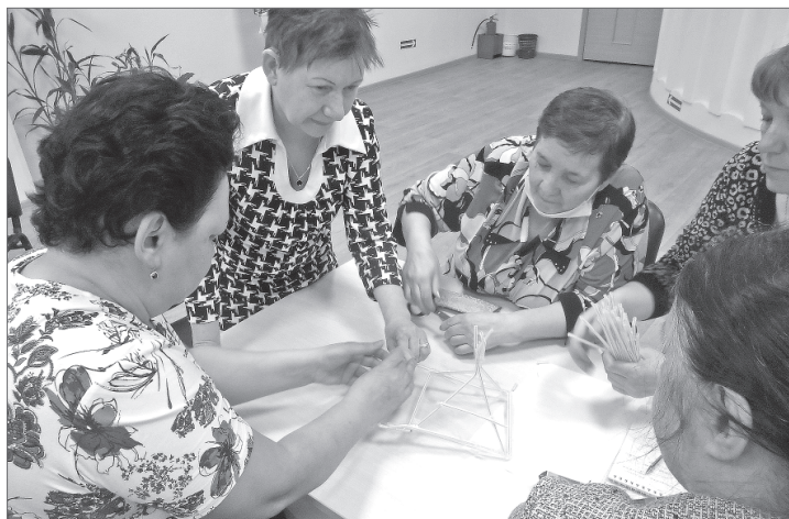
Виктория Витт.

Из нескольких направлений они выбрали оказание помощи детям и старикам.