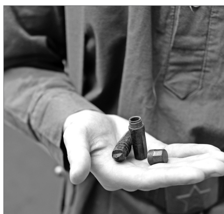
Одна из находок – медальон солдата.