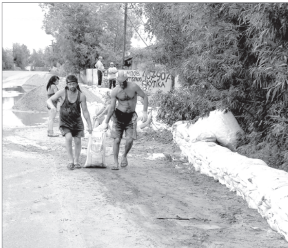
Две недели назад. Строительство дамбы у СОНТ «Огородник-81».

Также на встрече с руководителями крестьянско-фермерских хозяйств предложили оперативно составить перечень необходимых мер, которые властям нужно предпринять в первую очередь: например, выделить средства на приобретение животных, техники или кормов, а также компенсацию за погибший скот, урожай и так далее.