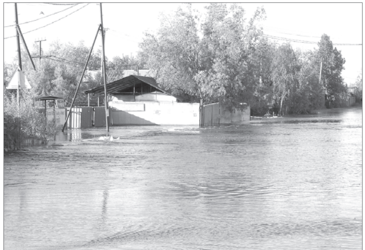
Та же дорога сейчас.