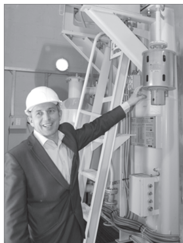
Новое оснащение подстанции.